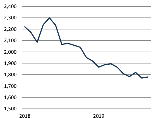
USD/tonn Heimsmarkaðsverð á áli

Breyting á föstu gengi krónunnar. Sýnir annars vegar þá 6 liði þar sem samdrátturinn var mestur og þá 6 liði þar sem aukningin var mest